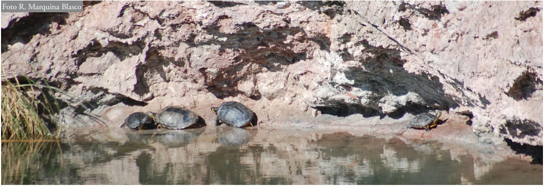
Figura 2: Ejemplares de Trachemys scripta asoleándose en Pozón de la Yesera (Gajano, Marina de Cudeyo, Cantabria).

de Yuso (2017), localidad al sur de Cantabria, recoge citas históricas de galápagos europeo y leproso en los “grandes humedales, carrizales y turberas de la orilla Sur y Este del Embalse del Ebro”, así como en San Miguel de Aguayo (Reinosa; Figura 1).