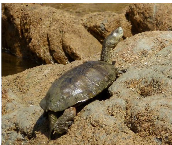
Galápago Leproso. Mauremys leprosa .