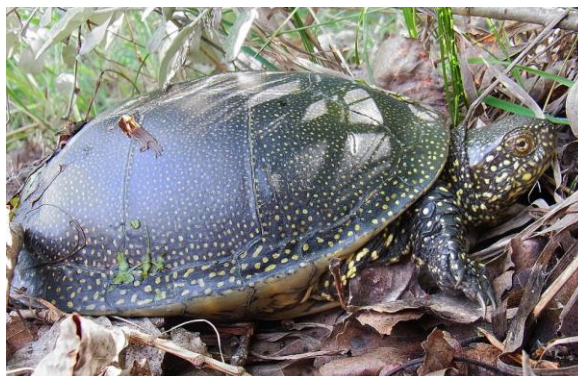
Galápago Europeo. Emys orbicularis .