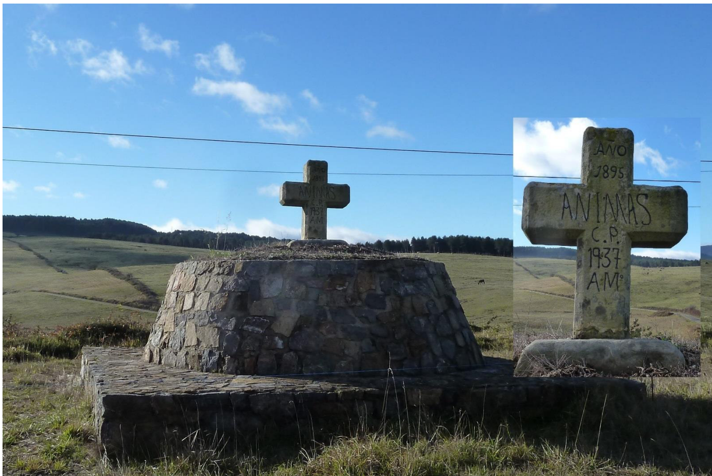
Inscripción en parte frontal (zona superior) AÑO 1895 en el centro ÁNIMAS, A M º (parte inferior) y por detrás ORZALES