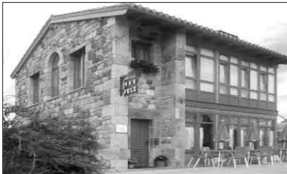
BAR FELI. Villasuso